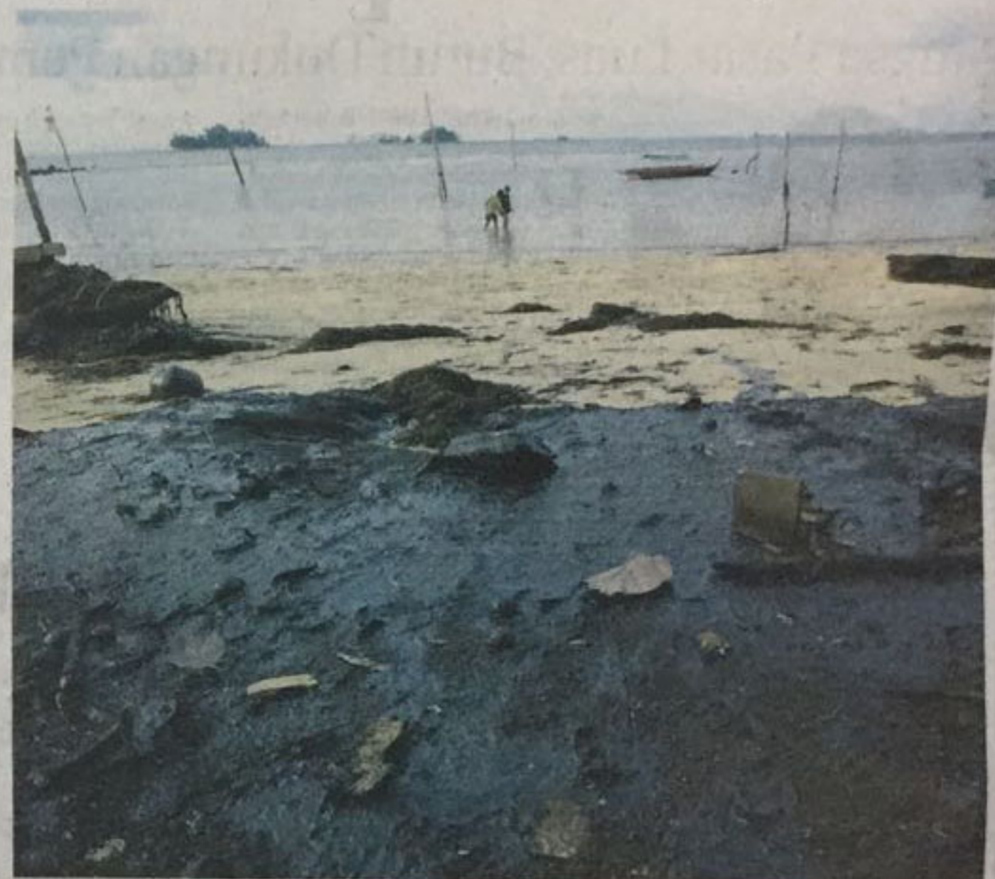
LIMBAH minyak hitam cemari Pantai Nongsa, Kamis (26/1/2017). Kejadian serupa kembali terjadi di awal tahun ini. DLH Batam meminta Kemenko Kemaritiman turun tangan untuk membicarakan hal tersebut dengan dua negara tetangga, Singapura dan Malaysia.

Maret lalu telah terjadi pencemaran limbah minyak, masing-masing terjadi pada tanggal 16 Maret 2018 di sekitar Turi Beach Resort dan tanggal 22 Maret di Nongsa Village. Terkait kejadian ini, Herman mengaku DLH Batam langsung melapor ke Kementerian Koordinator Bidang Kemaritiman dan Tim Daerah yang menangani pencemaran laut yang dikoordinir Pemerintah Provinsi Kepri guna penyelidikan lebih lanjut. ***